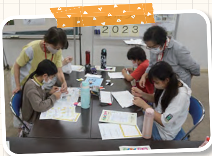
「手芸ボランティア」に作り方を優しく教えてもらいました