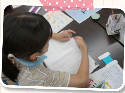
好きな色の糸を選んで タオルの周りを縫い合わせました