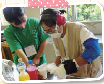
「コップに水を注ぐのも一苦労」

● 初めて会う人同士、初めは少し緊張も見られましたが、お互いを思いやりながら体験をすることができました。