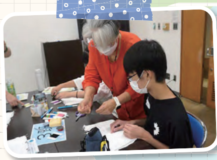
簡単にできる玉留めのしかたを 教わりました