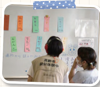
「文字の色や、紙の色によって見えやすさが違うな」

白内障眼鏡 白内障による色覚変化とぼやけて見える状態、加齢による視野の狭さや薄暗さを体験します。 肘膝サポーター・重り 加齢による関節の動きにくさと筋力の衰えを体験します。