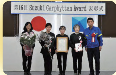
日鉄SGワイヤ(株)で行なわれた表彰式の様子