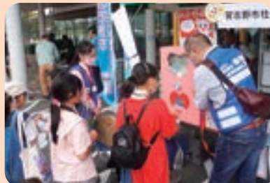
第30回市民まつり 習志野きらっと2023