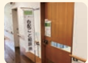
総合福祉センター2階 「心配ごと相談室」