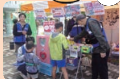
福祉ふれあいまつり

千葉県共同募金会習志野市支会 問合せ 社協 地域福祉推進課 ☎047(452)4161