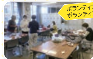
ボランティア室でボランティア活動

【利用施設】 研修室 会議室 和室 集会室 栄養指導実践室(調理室) その他、共有スペースとしてボランティア室、ボランティア情報コーナー、視覚障がい者のための広報紙の吹き込み等を行なう録音室があります。