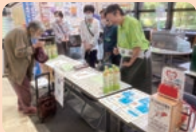
袖ヶ浦支部 いきいきサロン秋まつり