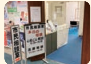
サンロード津田沼6階「市民相談室」