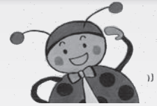
てんとうむし体操イメージキャラクター てんてんちゃん

「てんとうむし(転倒無視)体操」は、転びにくい身体づくりのために考案された、習志野市オリジナルの音楽付きの体操です。市民ボランティアの転倒予防体操推進員を中心に、身近な地域で広めています。