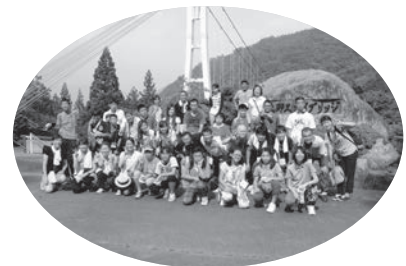
みんなで渡ったスカイブリッジ