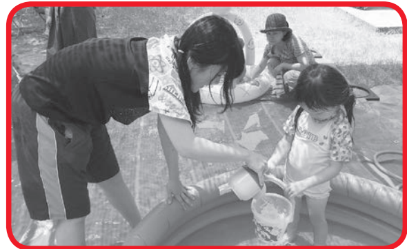
子育てサロンで子どもと水遊び