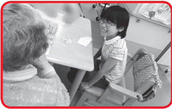
デイサービスセンターで高齢者と交流

「夏ボラ説明会」では小・中・高校生40人が、「ボランティアの心構え」「ボランティア活動中の注意点」などを学びました。参加者は、夏休みを利用して、高齢者施設での話し相手やお茶出し、夏祭りの手伝い、子育てサロンでの掃除や見守り、病院での外来患者の案内、袖ヶ浦団地図書館での貸出業務などの様々なボランティア活動に取り組みました。