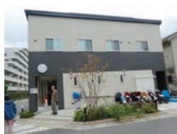
●奏の杜集会所 習志野市奏の杜 3-8-6 ラビット公園隣