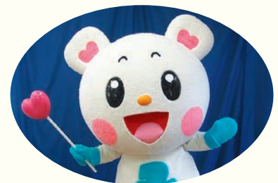
習志野市社協マスコット「ふくっぴー」