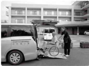
女性も活躍中です！

車イスのまま乗車できる福祉車両を運転し、公共の交通機関では外出困難な方々を病院や施設等へ送迎するボランティア活動です。