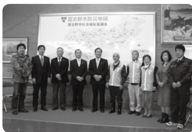
防災地図除幕式 (右から5番目が海寶会長) 平成23年2月20日